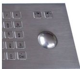
rackball 800 DPI