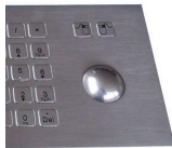
rackball 800 DPI