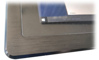
Marco fino y estético para una integración y acabado profesional

Monitor táctil de 17" de tecnología capacitiva multitáctil y ordenador fanless ruggedizado en chasis de aluminio cepillado. Sistema de refrigeración pasiva sin uso de ventiladores. Protección frontalmente ante el agua, protección IP65 en su parte frontal. Pantalla de alta luminosidad 1000 nits con tratamiento óptico para ser legible al Sol y mejorar su protección. Amplio rango de voltaje de 9V-36V.