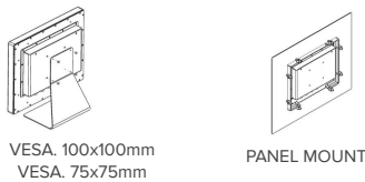
VESA. 100x100mm VESA. 75x75mm

VALORES DE PRODUCTO > Protección IP65 en su parte frontal > Pantalla retroiluminada con tratamiento óptico (optical bonding) para ser legible al Sol. > Resistente a entornos agresivos; polvo, grasa, vibraciones. > Resistente a altas temperaturas. > Muy bajo consumo de potencia.